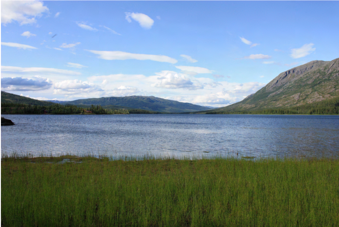
Foto: Helge Lynghaug, Nordland fylkeskommune. Bildet viser Mjåvatn i Vefsn kommune.