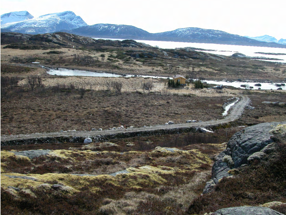
Foto: Arild Bondestad, Fjelltjenesten. Estetikk må vektlegges ved etablering av tiltak i strandsonen