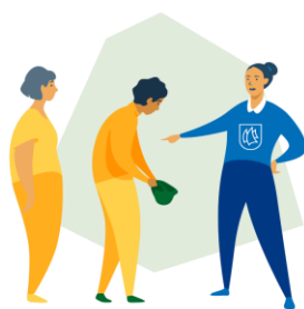
Kommune 1.0: Myndighetsutøveren Tro på: - Planlegging og styring - Rettsstatsprinsipper - Faget og kommunen vet best.

Kommune 3.0 er en metode hvor ansatte, politikere, innbyggere og næringsliv sammen finner ut hvordan et behov eller en utfordring skal løses. Det er fokus på mestring i alle livets faser og ansvarliggjøring av egne innbyggere.