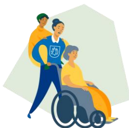
Kommune 2.0: Tjenesteleverandøren Tro på: - Markedsmekanismer - Serviceprinsipper - Kunden/brukeren vet best.