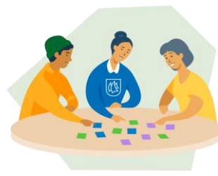
Kommune 3.0: Samskaperen Tro på: - Nettverksjobbing - Innovasjon og smidighet - Ingen vet best – vi utforsker sammen!